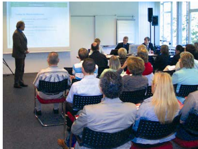
Insgesamt 435 Mitarbeiterinnen und Mitarbeiter der Standesämter im KIRU-Verbandsgebiet informierten sich über dvv.Standesamt.

Bis zum 18.12.2008 mussten 971 Standesämter in der zentralen Produktionsumgebung eingerichtet werden. Zusätzlich wurden alle Kunden, auch die dezentralen Nutzer, in die neue Version eingewiesen. Daten wurden aus der alten Version 6.7 in die Version 7 migriert. Damit konnten die Standesämter bis Ende 2008 nach altem Recht arbeiten. Noch vor Weihnachten wurde parallel die Produktionsumgebung für die Version 8.01 aufgebaut. Ab dem 22.12.2008 konnten sukzessive bereits Teildaten der Standesämter in die Version 8.01 übernommen werden.